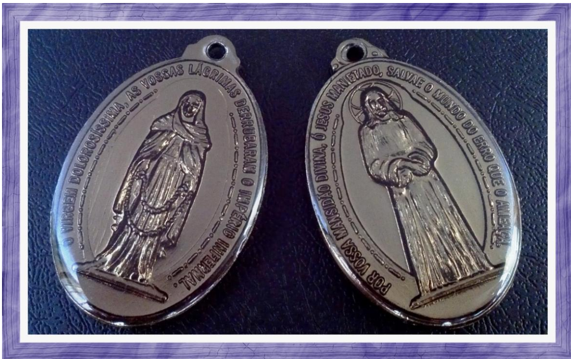
(Publicação do Santuário das Aparições de Jacareí - SP - Brasil)