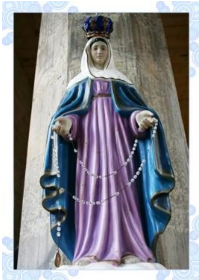
(IMAGEM NO SANTUÁRIO DAS APARIÇÕES DE JACAREÍ)